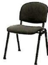
Sedia imbottita antracite