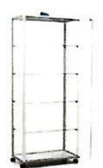
Vetrina in cristallo con chiave