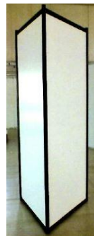
Totem alluminio laminato 100x250