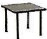
Tavolo fumo h40 piano 40x40 bianco/nero