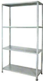
Scaffale metallico 4 ripiani