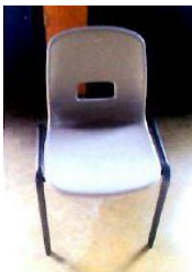
Sedia in PVC