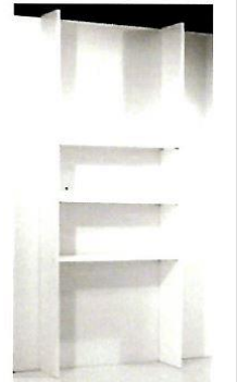
Scaffale laminato bianco 3/4 ripiani