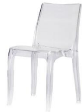
Sedia llaria trasparente